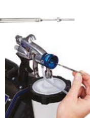
3. Extraiga la aguja.