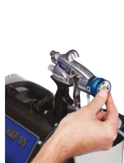
1. Retire la boquilla y el cabezal de aire de la parte delantera.