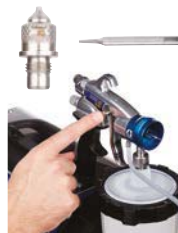
2. Deslice la palanca del gatillo para soltar la aguja.